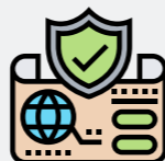
Servizio di notarizzazione: AUTENTICITY TRACE